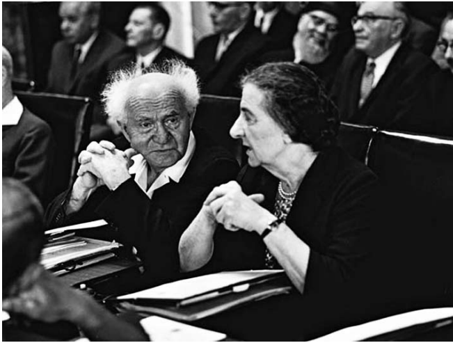
בן־גוריון וגולדה מאיר (שגרירה במוסקבה ושרת חוץ)

הרודני לבין מהותה של המהפכה הקומוניסטית, שלדעתו למרות הטרור לא איבדה את ערכה המוסרי ואת בשורתה הגואלת לאנושות. כעבור שישים שנה אמנם קרס המשטר הבולשוויקי הרודני, אולם גם רעיון המהפכה הקומוניסטית בטהרתה איבד את מקומו בדעת הציבור בארצות הדמוקרטיות.